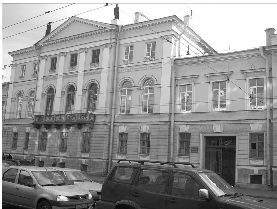
Fasada budynku, w którym mieściła się Cesarska Rzymskokatolicka Akademia Duchowna w Petersburgu.

Katolicki Uniwersytet w Lublinie, jego adresatem miało być nie tylko duchowieństwo, ale przede wszystkim świeccy – na humanistyce, na naukach społecznych, na prawie... Jednoznaczna dewiza Deo et Patriae przyświeca im od 100 lat.